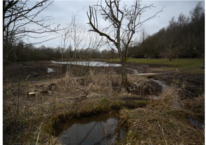
Bækkens tilløb til den nye regnvandssø nær Grimhøjgård lidt sydvest for Holmstrup.